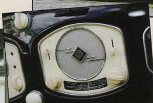
L'autoradio Telefunken est comme neuf. Il s'agit d'un modèle IA 50 produit pour un usage exclusif à bord des Coccinelle Split.