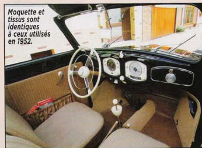
Moquette et tissus sont identiques à ceux utilisés en 1952.