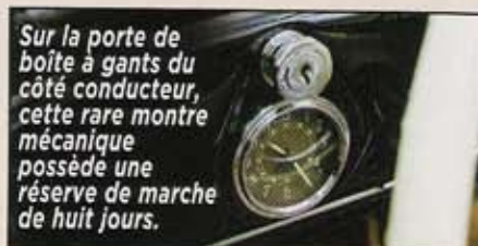
Sur la porte de boîte à gants du côté conducteur, cette rare montre mécanique possède une réserve de marche de huit jours.