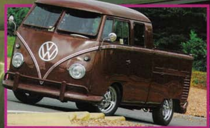
COMBI DOUBLE CAB 1961