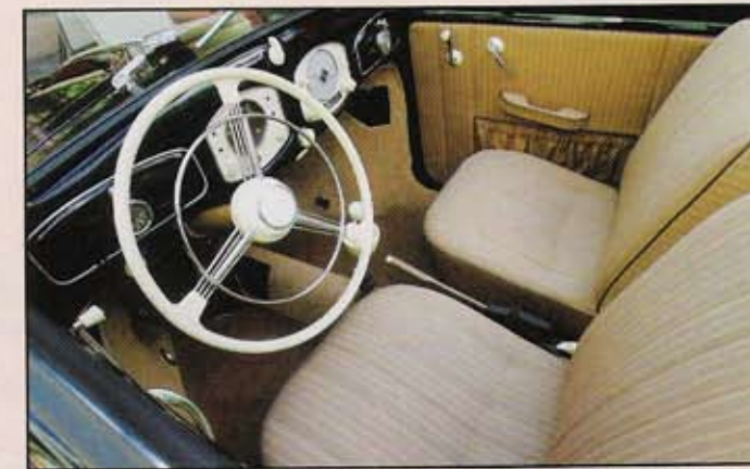
L'intérieur a été refait strictement comme à son origine, tant au niveau de la sellerie que de la composition des accessoires. Une référence.