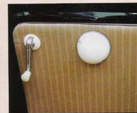
A l'arrière, ce cendrier en bakélite fait lui aussi partie des accessoires d'époque.