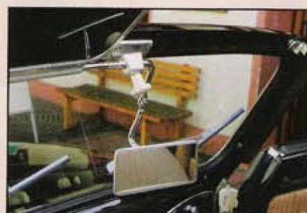
Le rétroviseur fait partie des pièces les plus difficiles à trouver dans ce type de restauration.