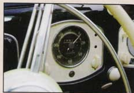
Sans aucun doute l'un des accessoires des plus rares : ce compteur de vitesse de Split possède un totaliseur journalier !